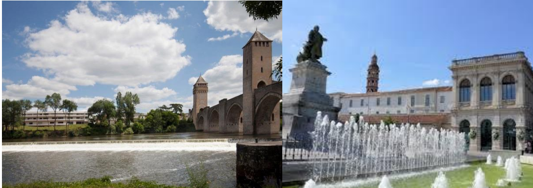
Hôtel récent proche du Pont Valentré, Place François-Mitterrand