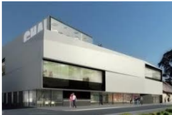
Quartier du 21 ème siècle