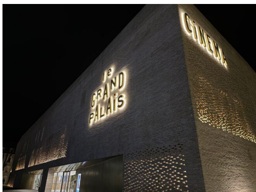
Cinéma Le grand Palais