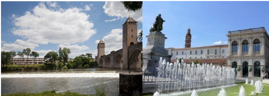
Hôtel récent proche du Pont Valentré, Place François-Mitterrand