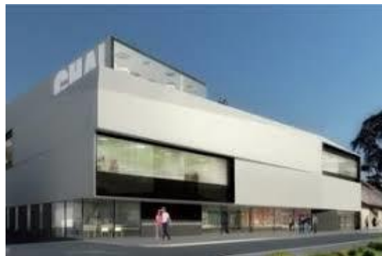
Quartier du 21 ème siècle