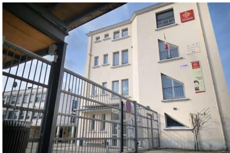
Entrée du Lycée Clément Marot